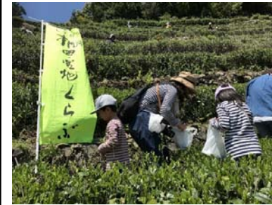
奥長島のだんだん茶畑