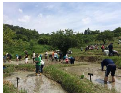
倉沢の棚田 田植え(6/2, 3)