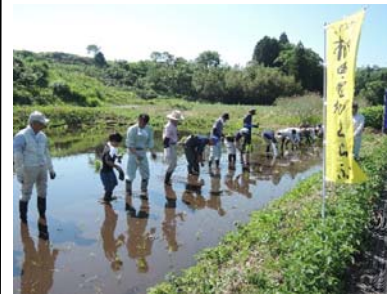
久保の棚田 田植え(5/25)